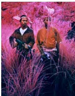
Hot rats, 2012 © Richard Mosse

10e édition pour ce qui s'appelait depuis 1997 la Biennale de la Photographie et des Arts Visuels de Liège, désormais rebaptisée Biennale de l'Image Possible (BIP). Un changement de nom qui reflète aussi le mouvement qui a modifié la physionomie de cette manifestation depuis sa création, s'intéressant de plus en plus aux propositions émergentes émanant des artistes, d'autant plus quand ceux-ci ébranlent les pratiques photographiques reconnues. Pour les organisateurs, il s'agit de prendre acte des évolutions majeures du champ artistique, de l'évolution rapide des usages culturels et sociologiques et donc des mutations du photographique au contact de ces transformations de société et de cette inclusion de plus