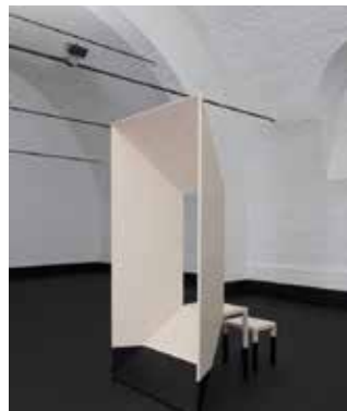
L'ordinateur portable 2 © Fabrica © CID Grand-Hornu © photo Gustavo Million

> Jusqu'au 5 février au Art and Design Atomium Museum, 1 Place de Belgique à 1020 Bruxelles.